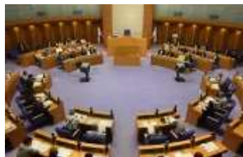
ぜひ一度、傍聴においでください！