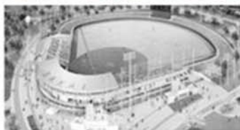
原池公園野球場(仮称)完成予想図 もう間も無くてす!

A 建設局長: 公園が地域のまちづくり活動の場としても活用できるよう可能な限り配慮し対応する。大型車15台、普通車530台の駐車場を確保する。こけら落としについてはオリックスとの連携事業を検討。