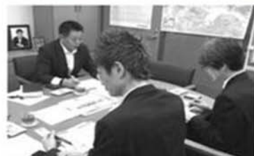
質問作成にあたっては議員会館で霞が関の官僚からも情報収集します!

こんな時代だからこそ多様性を優しさで包み込む堺市であってほしいとの思いから、LGBTの方々が自分らしく生きられる世の中に向けての取り組みや、生物多様性の保全、ダナン市との友好都市締結の意義等、持続可能で包摂生のある社会の実現に向けた具体的な取り組みについて市長の考えを伺いました!