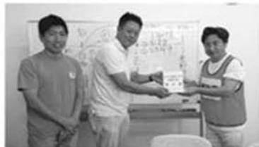
駅前等で皆様からお預かりした義援金は直接、総社市長に届けられました!

昨年は災害の多い年でした。ソフト面の防災という視点から「自ら命を守る防災」をテーマに各局と議論。最も重要な水の確保に向けた、上下水道局の取り組みや公的機関の備蓄状況、防災協定を結んでいる事業者との連携についても確認しました。あわせて、大規模災害発災時に子供たちがどんな状況にあっても、まず、自分の身を守る力を身につけてほしいとの願いから、義務教育課程における防災教育の更なる充実を求めました!