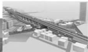
南花田鳳西町線事業 (金岡・白鷺地区)