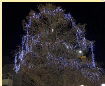
1月～2月 深井駅前イルミ

「コロナ禍で厳しい状況に置かれている同業の飲食店はもちろん、多くの人にとって希望の光になってほしい」との思いで、深井周辺で飲食店を営む若手オーナーを中心に初めて開催された深井ファンイルミネーションプロジェクト。私もサポーターとして全力で応援させて頂きました！今年のクリスマスは更なるバージョンアップの予定です！