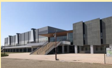
3月23日 新大浜体育館内覧

老朽化した前大浜体育館にかわり、大浜公園内に4月から新たにオープンする大浜体育館・大浜武道館の内覧会に参加してきました！地上2階建て、延べ床面積13000㎡を誇り、アリーナには最大3000名を収容可能で、各競技のトップチームの大会や試合も開催される予定です！今からワクワクします！